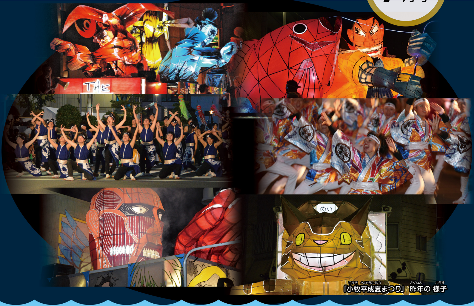
こまき へいせいなつ さくねん ようす [小牧平成夏まつり] 昨年の様子