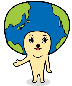
こまきし かんきょう きやらくたー 小牧市環境キャラクター エコリン