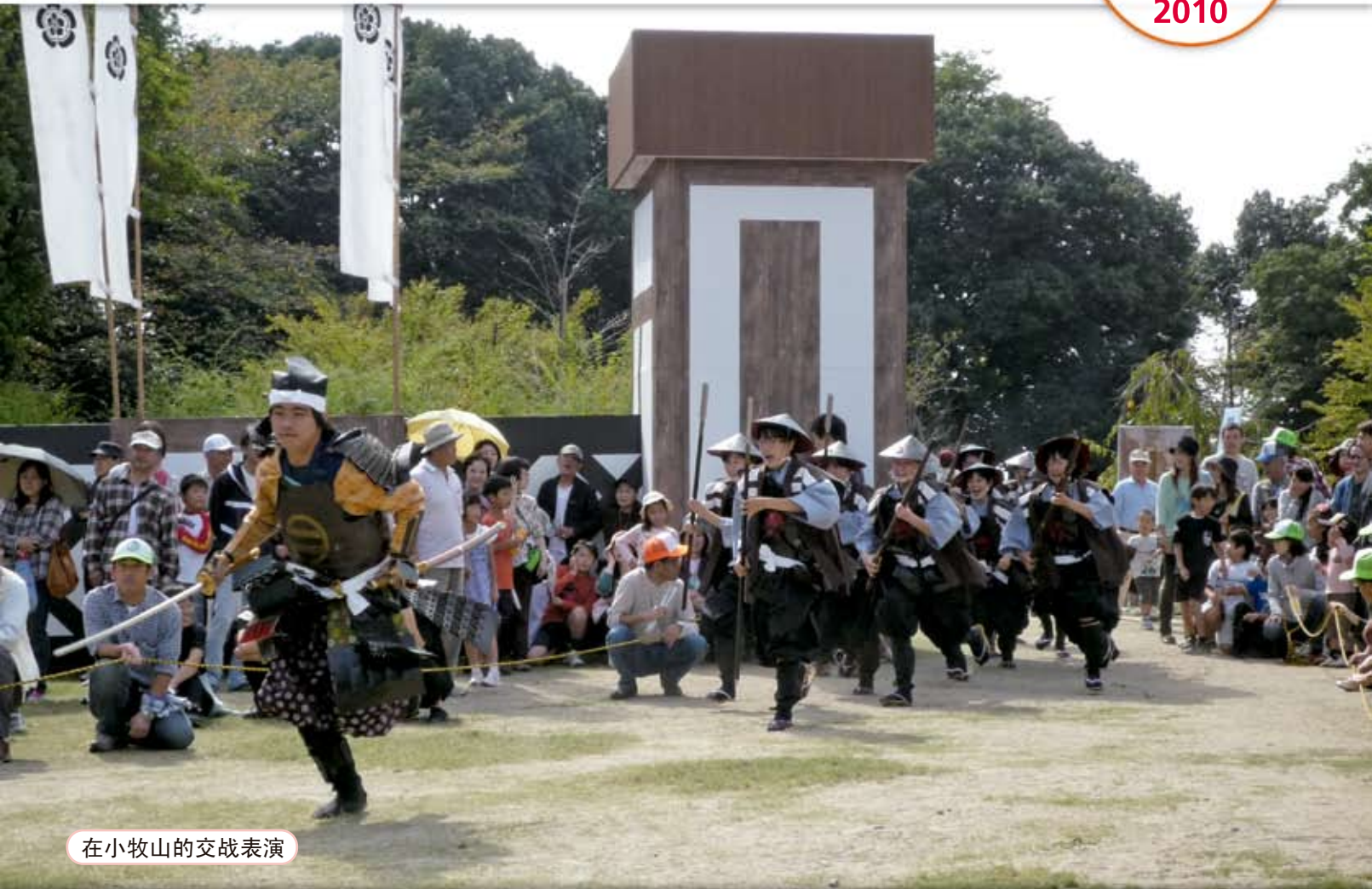
在小牧山的交战表演