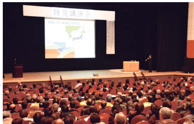
Imagem da Conferência sobre Prevenção de Desastres

Contato Divisão de Gestão de Crises TEL.0568-76-1171