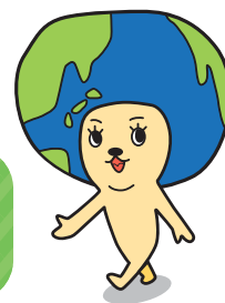
Personagem representante do meio ambiente de Komaki "Ecorin"

Favor prestar atenção aos seguintes itens para a colocação dos materiais recicláveis e do lixo.