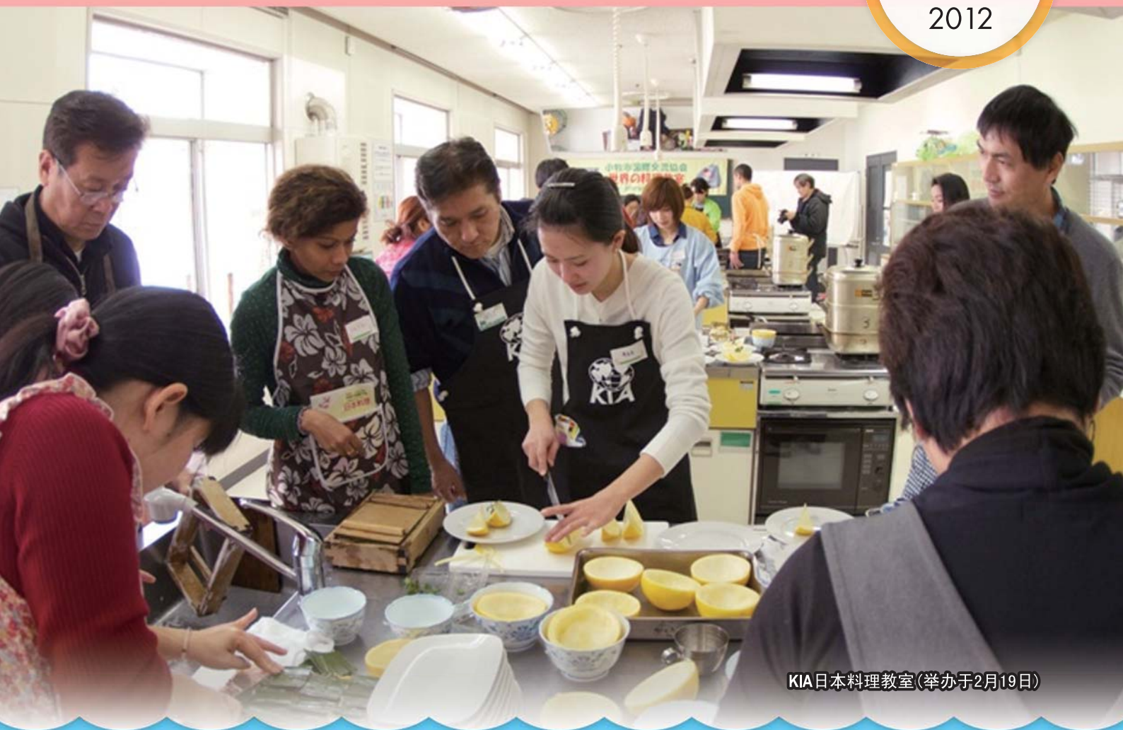
KIA日本料理教室(举办于2月19日)