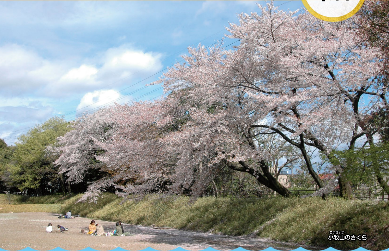
こまきやま 小牧山のさくら