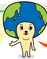
こまきし かんきょう きやらくたー 小牧市環境キャラクター 「エコリン」