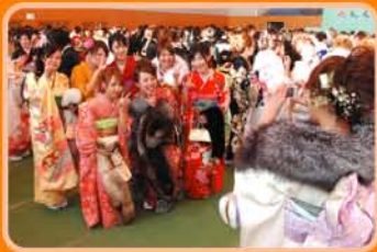
2009年小牧市成人典礼

时 间 2009年1月11日(星期日) 下午1点30分~(签到下午1点~) 会 场 小牧市竞技公园 参加者 于1988年4月2日~1989年4月1日 出生,并在小牧市有居民登记的人员 请于当天直接到会场。 咨询处 终身学习课 (TEL76-1179)