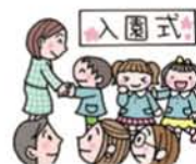
托 儿 所 一 览 表