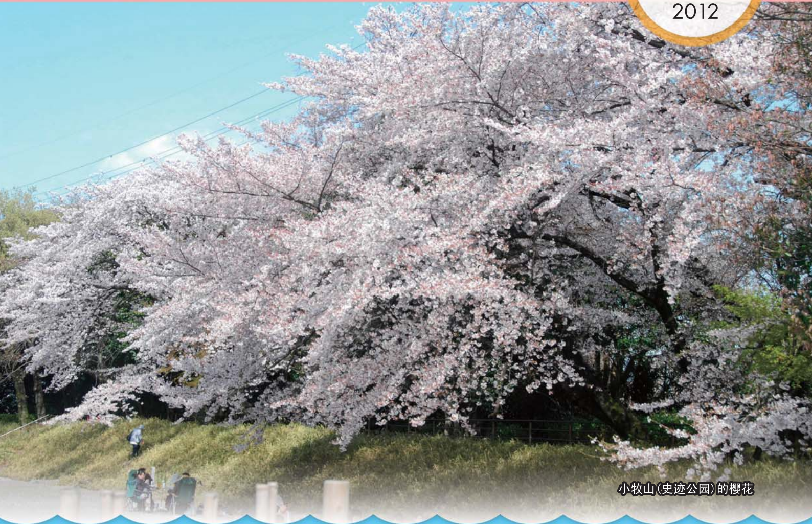
小牧山(史迹公园)的樱花