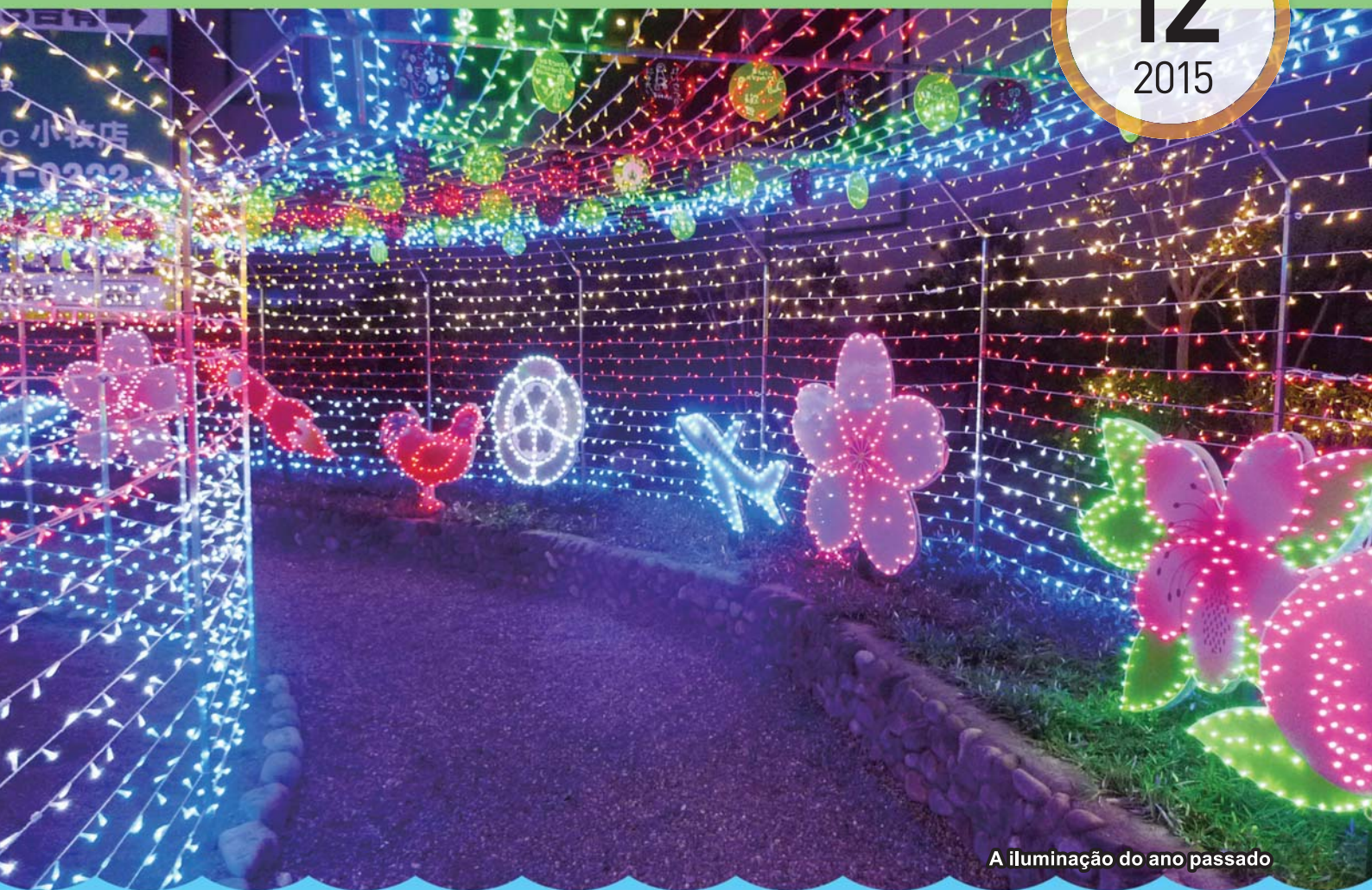
A iluminação do ano passado