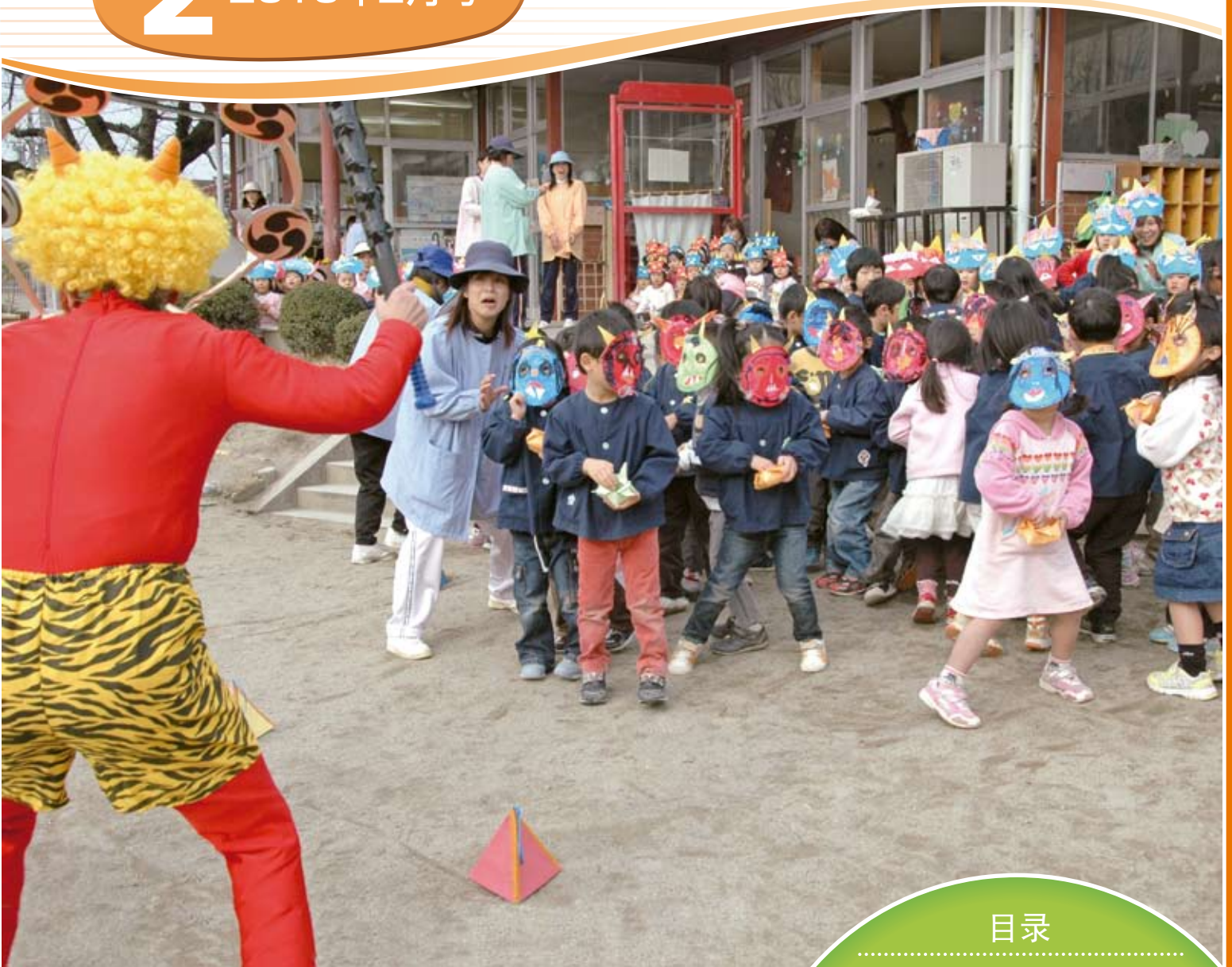
節分の撒豆 (详细内容请见第3页)