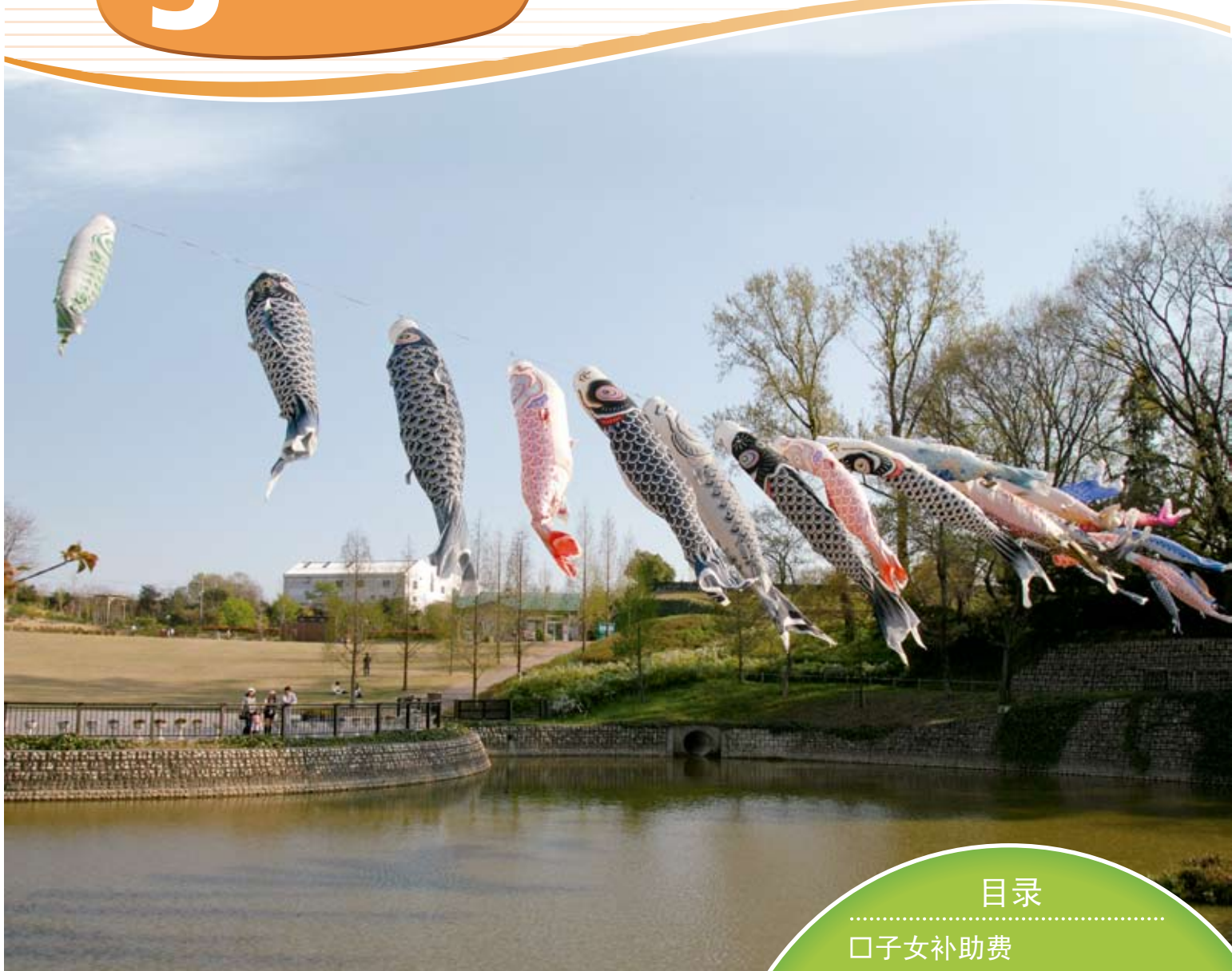
四季森林里的鲤鱼旗