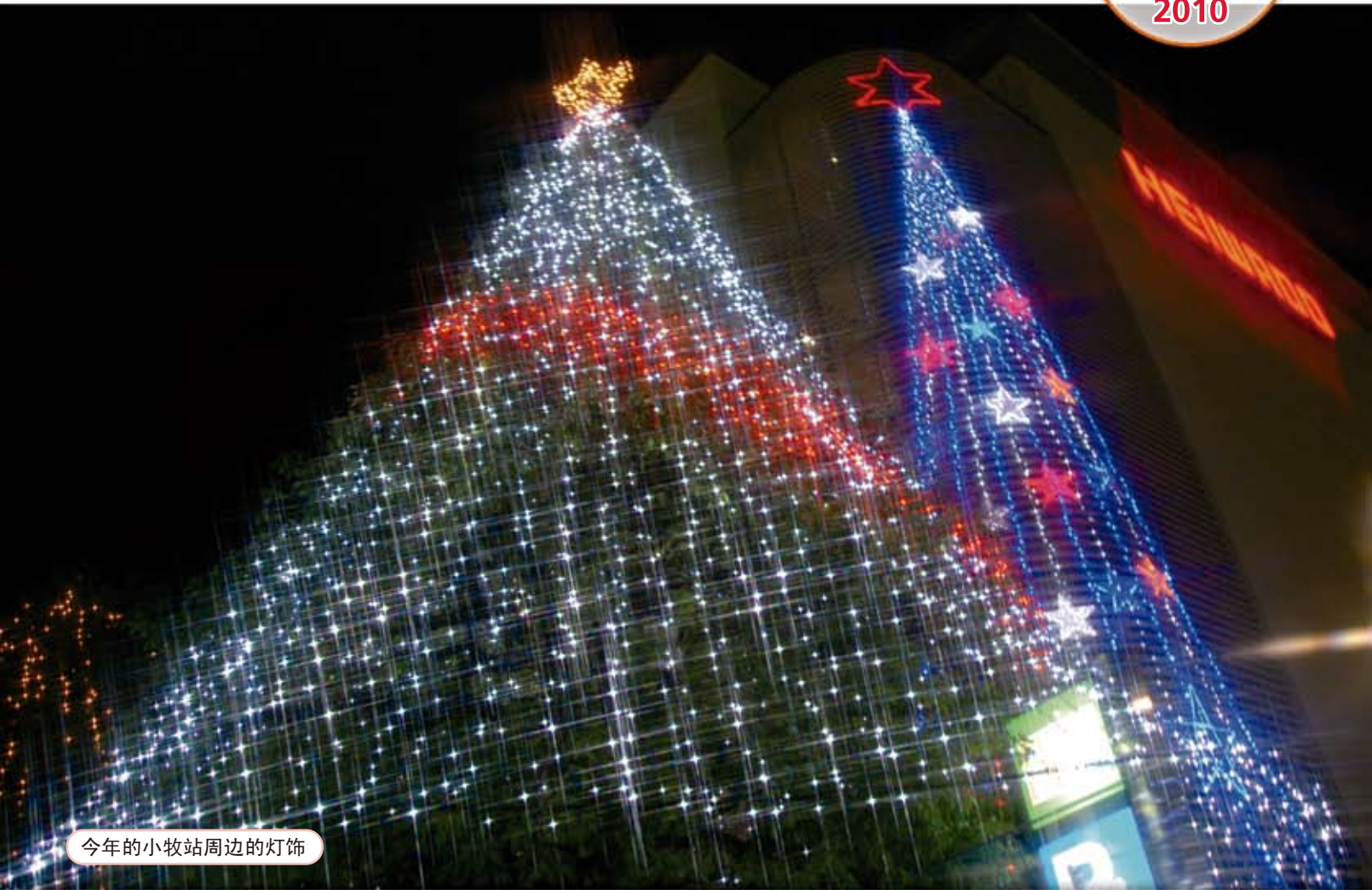
今年的小牧站周边的灯饰