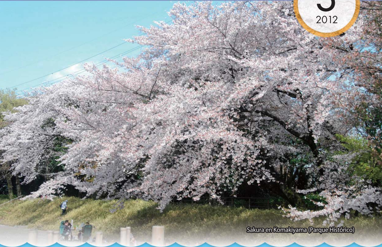
Sakura en Komakiyama (Parque Histórico)