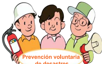
Prevención voluntaria de desastres

El 20 de septiembre (martes) del año pasado, debido al acercamiento del tifón No. 15, que produjo lluvias torrenciales. La Asociación Voluntaria de Prevención de Desastres realizó la instalación de los lugares de refugio en los Salones de Reunión entre otras actividades. La Asociación Voluntaria de Prevención de Desastres tiene la función de prevenir y disminuir los desastres. Informémonos frecuentemente, para así poder proteger a nuestras familias de los desastres.