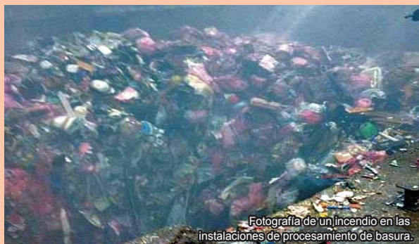
Fotografía de un incendio en las instalaciones de procesamiento de basura.