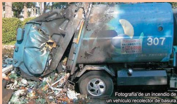
Fotografía de un incendio de un vehículo recolector de basura.