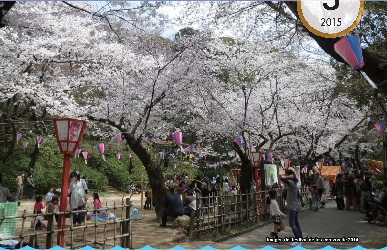
Imagen del festival de los cerezos de 2014