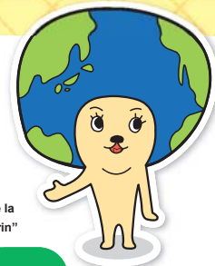
El personaje ecológico de la ciudad de Komaki "Ecorin"