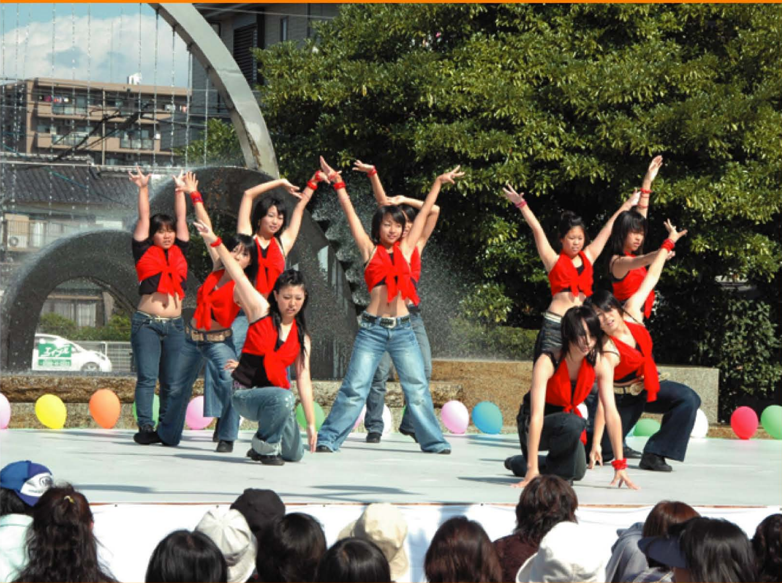
第28届小牧市民节 (Dance Mix)