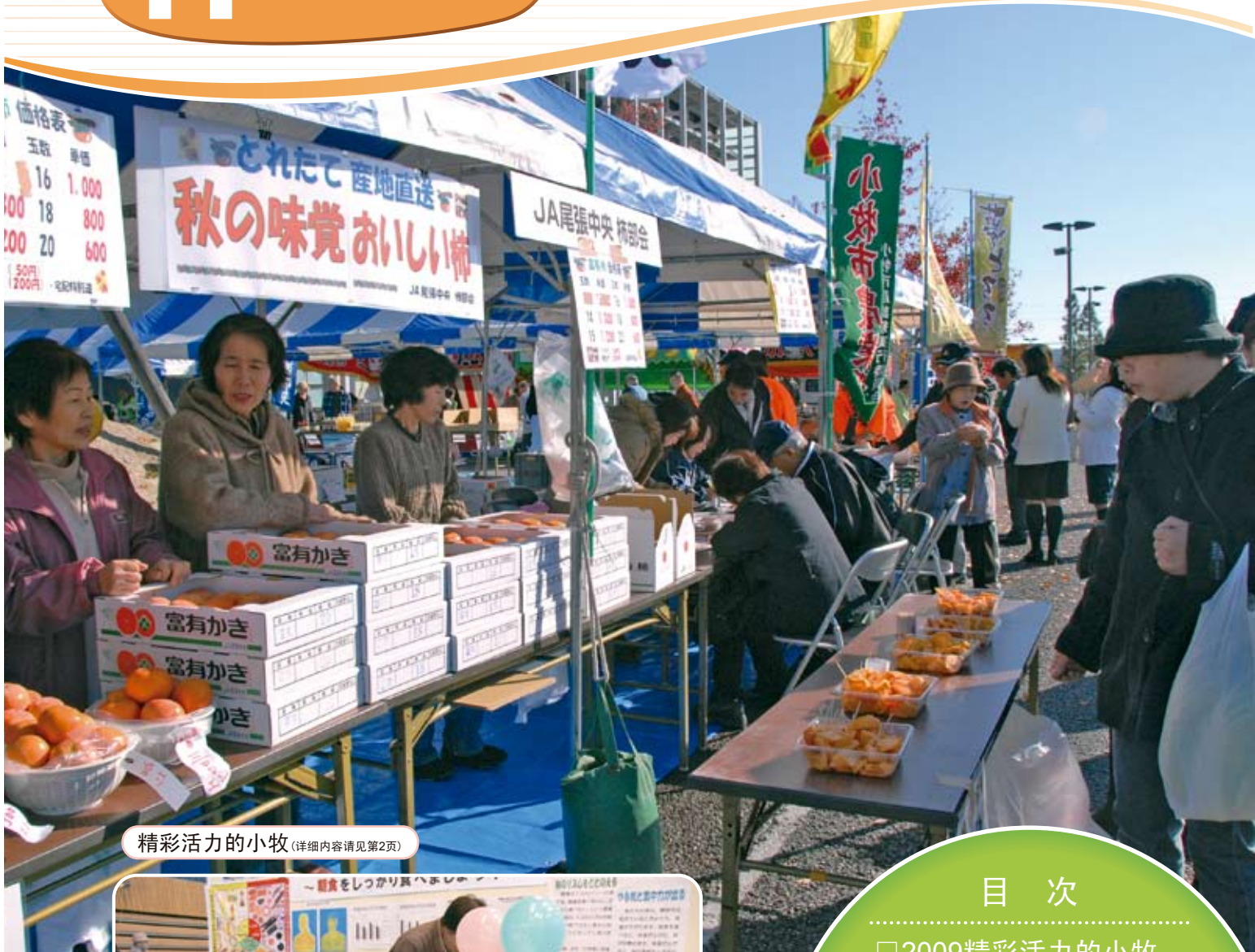
精彩活力的小牧 (详细内容请见第2页)

在小牧市的中国人人口 / 1,099人 小牧市的人口 / 153,782人 2009年10月1日现在