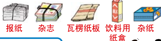
报纸 杂志 瓦楞纸板 饮料用纸盒 杂纸