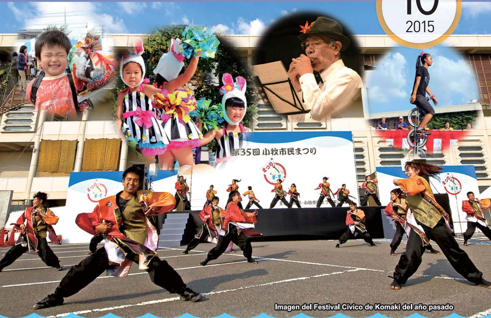
Imagen del Festival Cívico de Komaki del año pasado