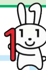
El personaje de relaciones públicas “Maina-chan”

Desde octubre de 2015, se comunicará a cada uno de los ciudadanos, un número de 12 dígitos “My Number” (número personal)