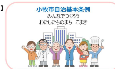
【小牧市自治基本条例】