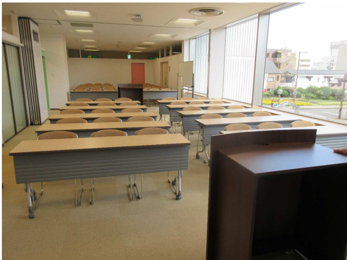
▲多目的室1と2を一体利用した際の写真