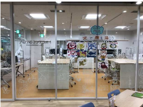
デジタル機器が揃ったプログラミングラボ 1