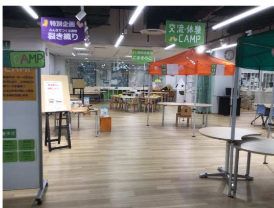
オープンなイベントスペース