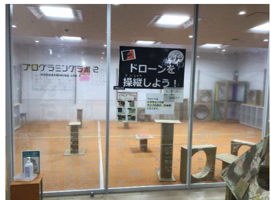
カーペット敷きのプログラミングラボ 2