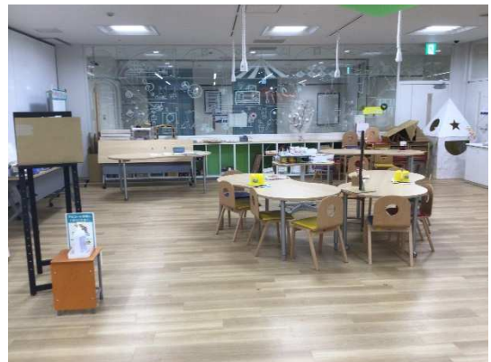
使い道の多いワークスペース 2