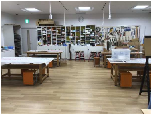
工作に使うワークスペース 1