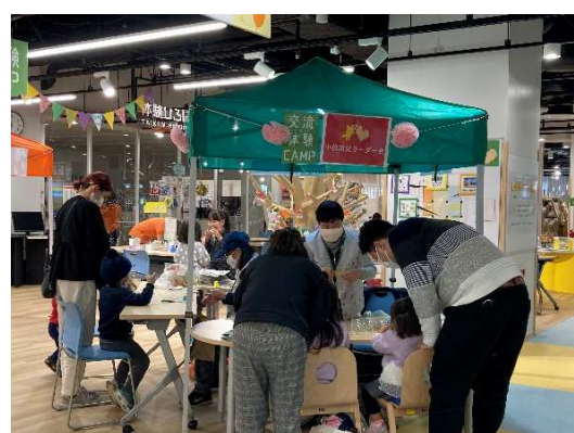
交流・体験CAMPの様子