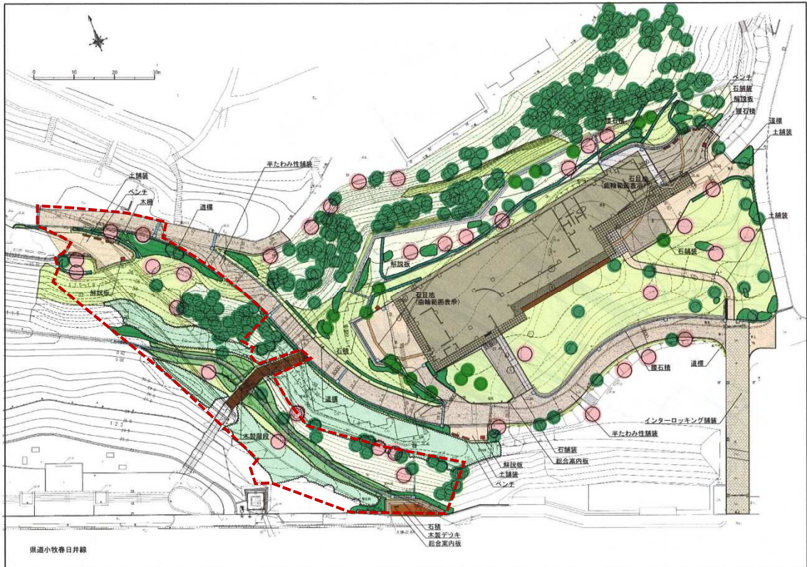
図1 小牧山城史跡情報館周辺（管理道部分）整備実施設計範囲