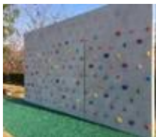
ボルダリングウォール