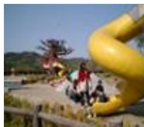
わんぱく冒険広場