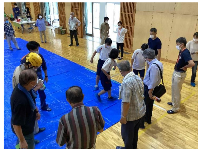
防災訓練のリハーサル