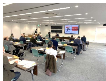
▲代表者会議の様子