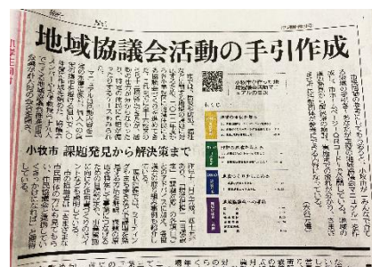
▲中日新聞の掲載記事