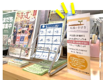
▲ワクティブこまき窓口