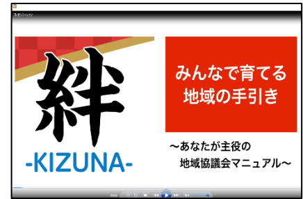
▲動画タイトル画面