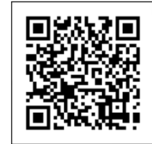
▲地域協議会 YouTube チャンネル (チャンネル内の動画から)