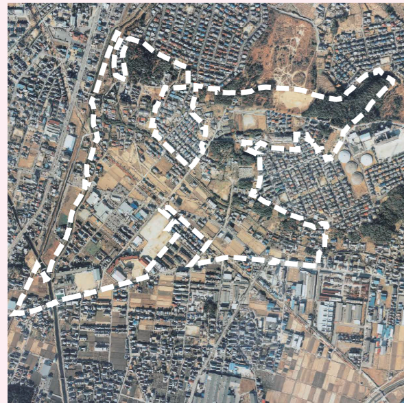
小松寺土地区画整理事業