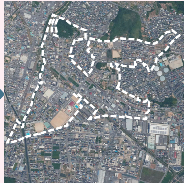
小松寺土地区画整理事業