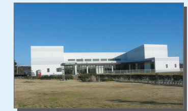
リサイクルプラザ プラザハウス