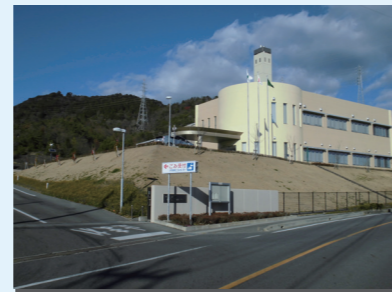
小牧岩倉衛生組合環境センター (愛称:小牧岩倉エコルセンター)

※都市計画決定: 昭和55年9月22日(小牧市告示第35号)(当初) 平成22年12月24日(小牧市告示第105号)