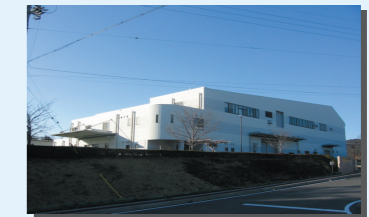
リサイクルプラザ リサイクルハウス