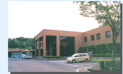
尾張東部火葬場 (尾張東部聖苑)

※都市計画決定: 昭和53年9月29日(小牧市告示第53号)(当初) 平成22年12月24日(小牧市告示第123号)