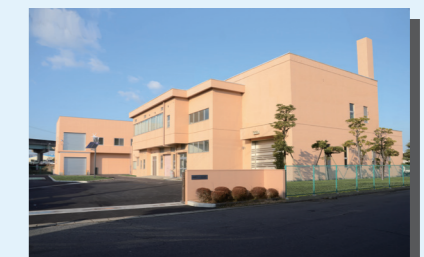
小牧市クリーンセンター