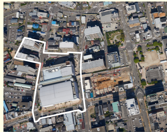
高度利用地区(小牧駅西側)