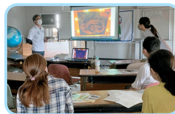
Hình ảnh hoạt động lần trước Từ “Bạn là phóng viên”

Hãy cùng xem “Tạp chí thông tin đời sống Komaki” và thường thức cuộc sống ở thành phố Komaki nhiều hơn nữa!