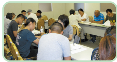
べんぎょうの ようす

日時 9月12日~11月28日(日曜日 13:00~16:30) (全部で 12回) 場所 小牧市公民館4階 チェスルーム 対象 かんじを勉強したい 外国人の方なら だれでも きてください 参加費 0円 申し込み 申し込みは いません。勉強の 場所へ きてください。