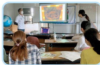
前回の 活動の ようす

その他 電話や メール、ラインで 連絡できる人。新型コロナの 病気の ために 予定が 変わることが あります。