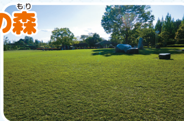
場所: 小牧市大字大草5786-1