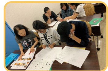
まえ かつどう 前の 活動の ようす