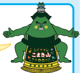
小牧市マスコットキャラクター「こまき山」