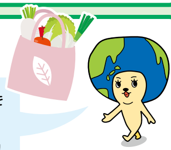
こまき市環境キャラクター「エコリン」

レジで「マイバッグを持っています。レジ袋は 必要ありません。」と 伝えましょう!