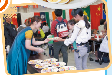
2018年のワールドレストラン