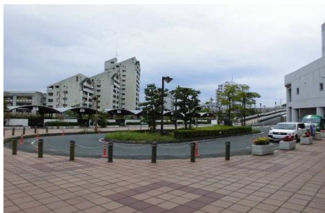
桃花台センターバス停前ロータリー

2 目的及び効果 今後、人口減少や少子高齢化が進む状況の中で、居住の誘導と都市機能の集積を図り、多極ネットワーク