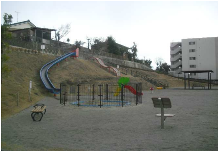
東前公園(平成28年度施工)

○児童遊園(5か所施工) 予算額 58,030千円 経年劣化が進む児童遊園を、安心して遊べる児童遊園とするため、 計画的に施設再整備を行います。