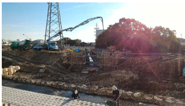
河川水路整備事業 (新濃尾土地改良関連整備事業)