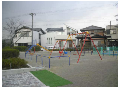
大池児童遊園(平成29年度施工)