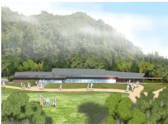
史跡センター完成予想図 (鉄骨造平屋建 約1,000㎡)

平成26年度に策定の「(仮称)史跡センター整備基本構想」に基づき、史跡センターの建築や展示制作を行います。