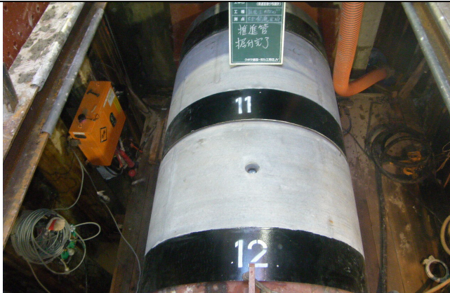
令和5年度実施 県道宮後小牧線外 φ500mm送水管布設工事