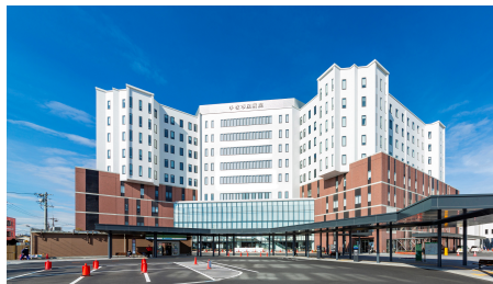
小牧市民病院外観