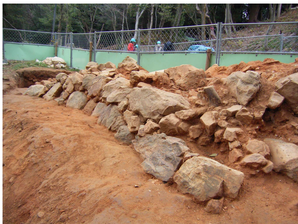
大手道部分の発掘調査で見つかった石垣