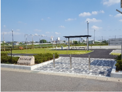
市之久田公園(平成30年度施工)

経年劣化が進む児童遊園を、安心して遊べる児童遊園とするため、計画的に施設再整備を行います。