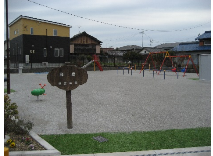
藤島児童遊園(平成30年度施工)