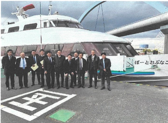
管理組合のフェリー前