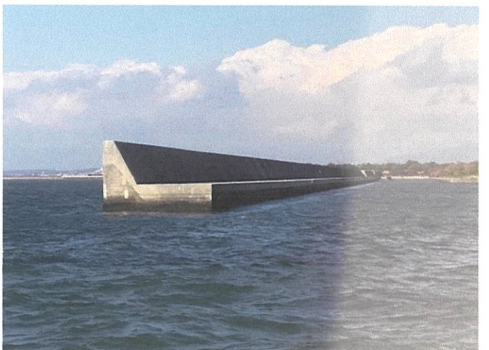
高潮防波堤 ※白い箇所が嵩上げ