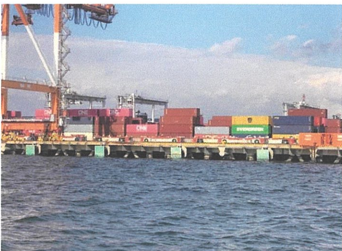
ヤード間を自動制御で往復する自動搬送台車AGV ※手前の車がAGV