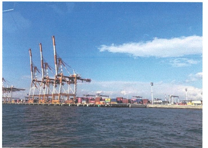
ガントリークレーンでコンテナ作業