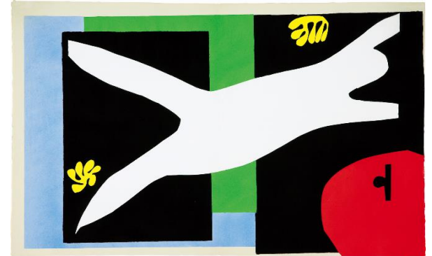
アンリ・マティス 《ジャズ》より〈水槽を泳ぐ女〉1947年刊 メナード美術館蔵 2019/5/23-6/30展示