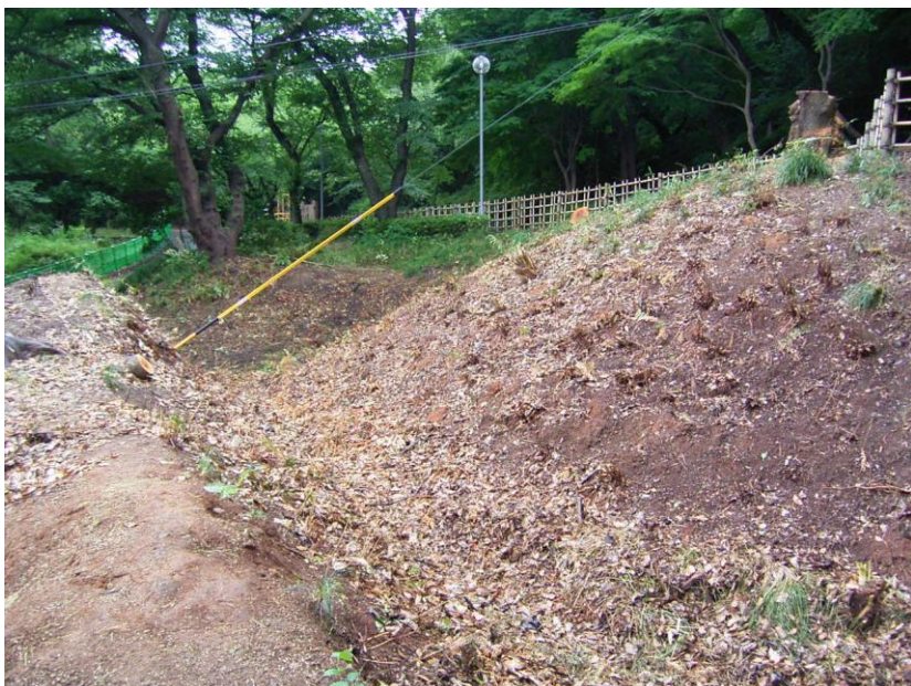
樹木伐採後のC地区

小牧山南麓の発掘調査現場（C地区）では調査に支障となる樹木の伐採が概ね完了し、いよいよ調査が始まりました。