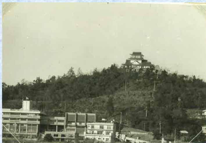
小牧山外観（昭和四十二年頃）

今でこそ深い緑に覆われ、豊かな自然の宝庫ともいえる小牧山ですが、戦国時代、城郭として利用されていたときは木は全て切り払われ、丸裸でした。江戸時代の絵図をみると松と竹が主体の外観だったようです。昭和34年の伊勢湾台風により山中の木々の多くが倒れてしまいました。現在生えている樹木のほとんどはその後成長したものと思われる。