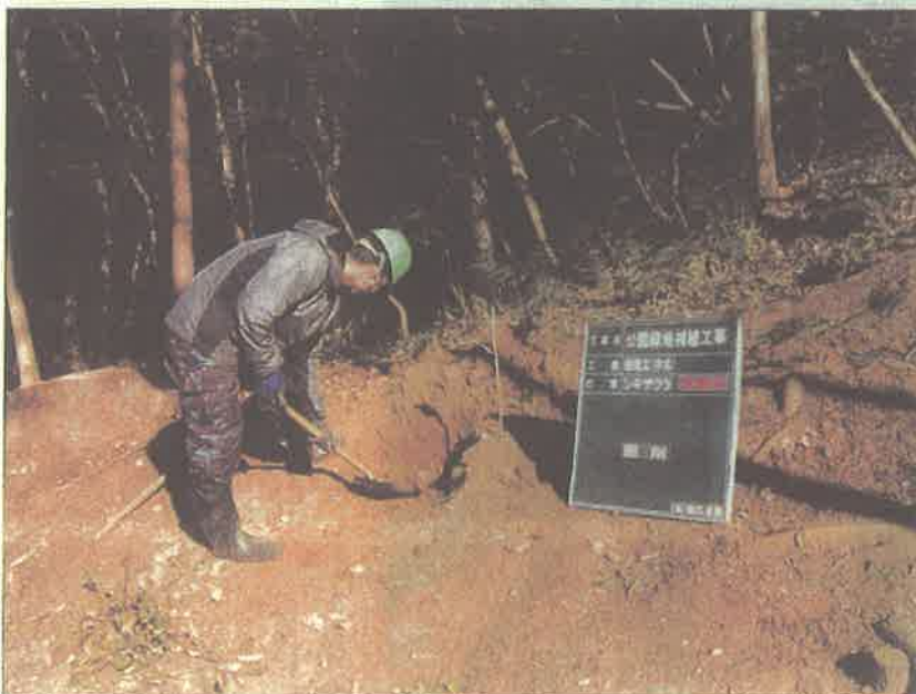
写真区分: 施工状況写真 工種: 植栽工 種別: シキザクラ 写真タイトル: 植穴掘り状況