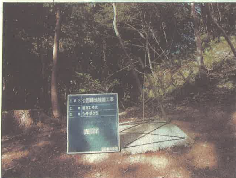
写真区分: 着手前及び完成写真 工種: 植栽工 種別: シキザクラ 写真タイトル: 完了