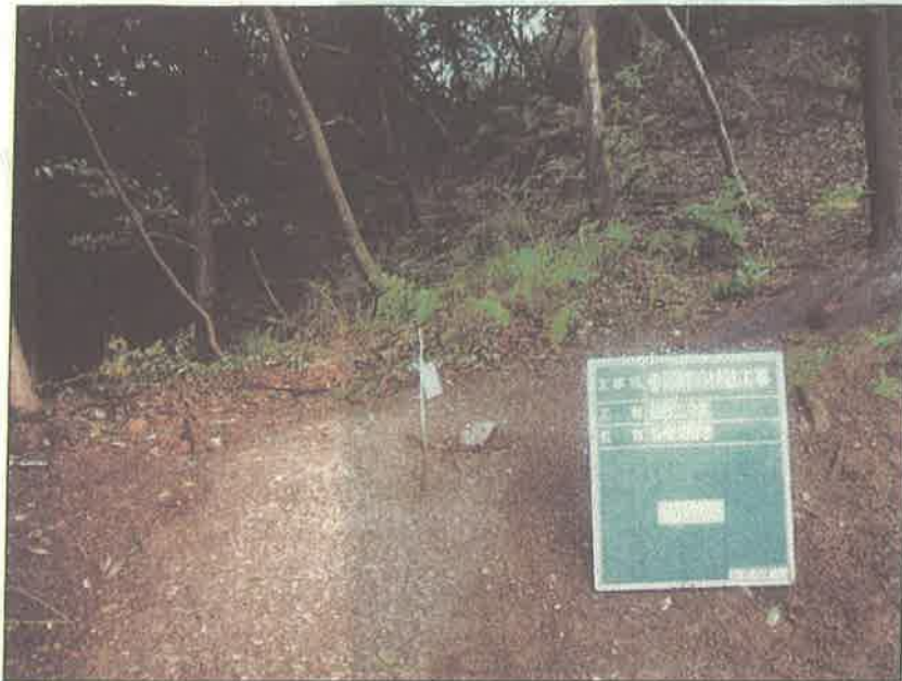
写真区分: 着手前及び完成写真 工種: 植栽工 種別: シキザクラ 写真タイトル: 着手前