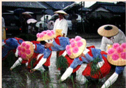
稲沢市 お田植え祭(6月)