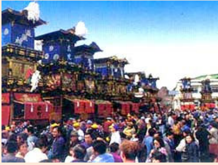
犬山市 犬山祭り 4月

この「食育の日」に、みなさんも愛知県の食文化を振りかえってみましょう。昔から、五穀豊穡と人々の健康や子孫繁栄を神々に祈り、その時々で食べられる行事食・伝統食・郷土食の多くは、米を中心としていました。みなさんのまわりでは、どんなものを食べてきたのか、家族で話し合ってみましょう！