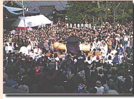
小牧市 田縣神社の豊年祭(4月)