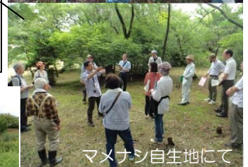
マメナシ自生地にて