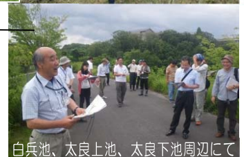
白兵池、太良上池、太良下池周辺にて