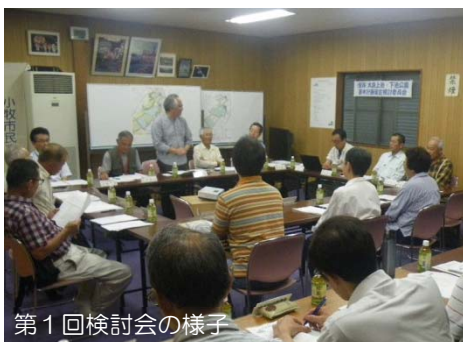
第1回検討会の様子