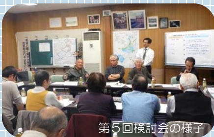
第5回検討会の様子

第5回目となった今回は、主に基本計画図の素案の各ポイント（地点）について、整備のあり方・運営管理のあり方を確認しました。