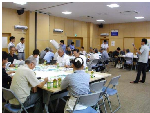
第2回ワークショップの様子