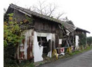
建築物のイメージ