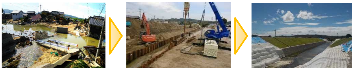
<末政川復旧工事の様子>

甚大な被害が生じた真備地区の土地約 1,600 筆の土地について、登記官が 700 人を超える登記名義人の法定相続人の探索を実施しました。法定相続人情報の活用により所有者探索が大幅に省力化されました。