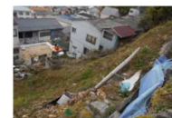
高台から瓦礫や岩石、柵等が落下するおそれ