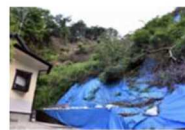
豪雨の度に土砂崩れが多発