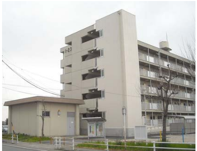
公営住宅等ストック総合改善事業 整備イメージ(EV設置)