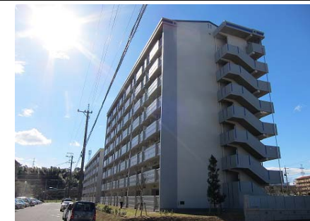
公営住宅等整備事業 整備イメージ

愛知県、豊橋市、岡崎市、一宮市、半田市、春日井市、豊川市、津島市、碧南市、刈谷市、豊田市、安城市、西尾市、蒲郡市、江南市、小牧市、稲沢市、新城市、東海市、大府市、知多市、知立市、尾張旭市、田原市、みよし市、豊山町、武豊町、設楽町、東栄町