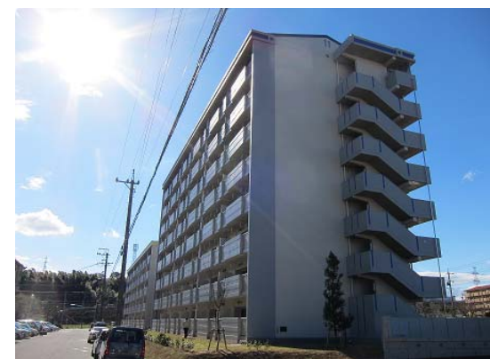
公営住宅等整備事業 整備イメージ